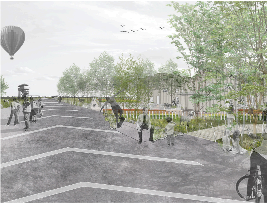
La piste (vue 1)