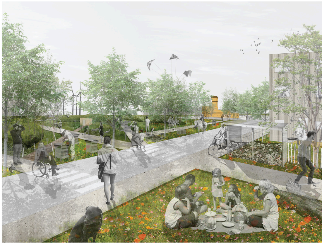
Le parc écologique (vue 2)