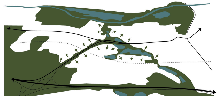
> 2ÈME MOUVEMENT : QUESTIONNER LES LIMITES VILLE-NATURE EN REPARTANT DU PAYSAGE > 2ND MOVEMENT : TO QUESTION THE LIMITS OF CITY-NATURE FROM LANDSCAPE