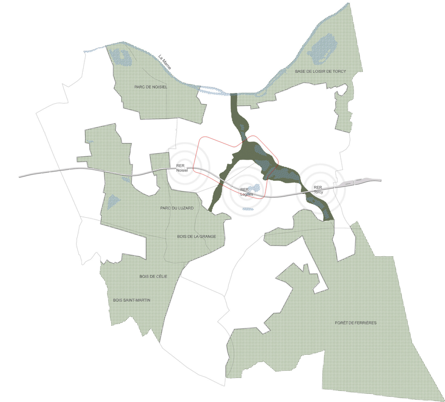
> LES GRANDES CONTINUITÉS PAYSAGÈRES DU VAL MAUBUÉE : UNE FIGURE TERRITORIALE DE PROJET > THE MAJOR LANDSCAPE CONTINUITIES OF THE VAL MAUBUÉE : A TERRITORIAL FIGURE OF PROJECT