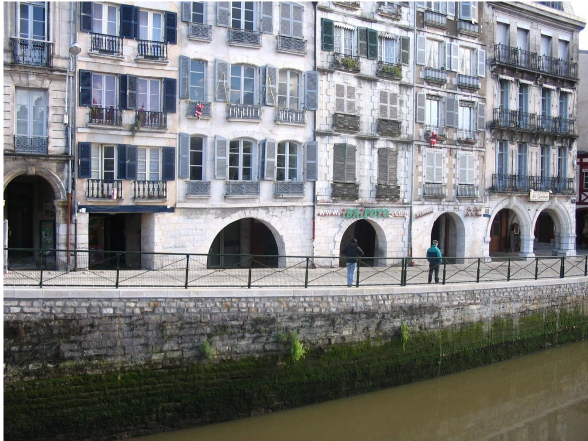
Vue du quai depuis le pont Marengo