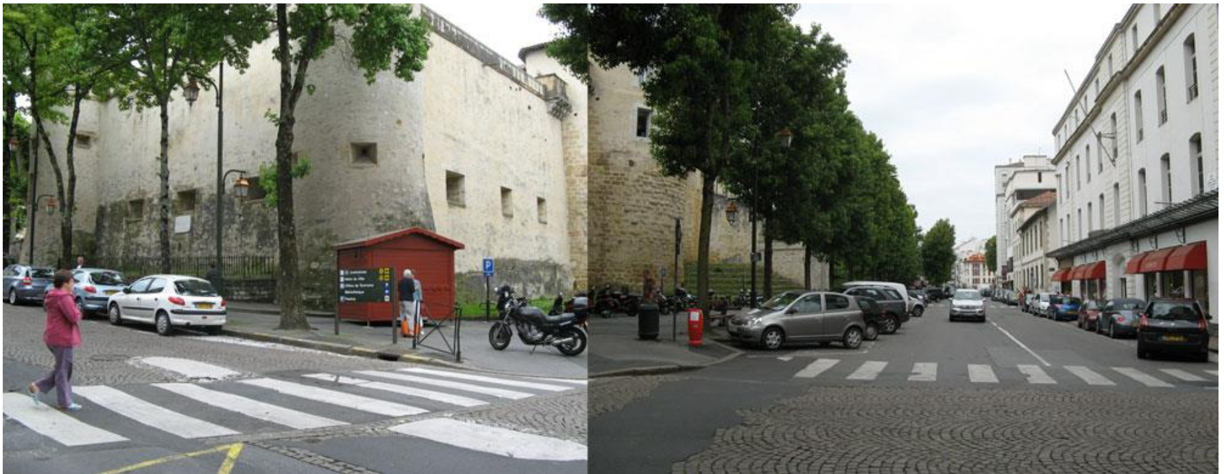
Vues de la place Jacques Portes