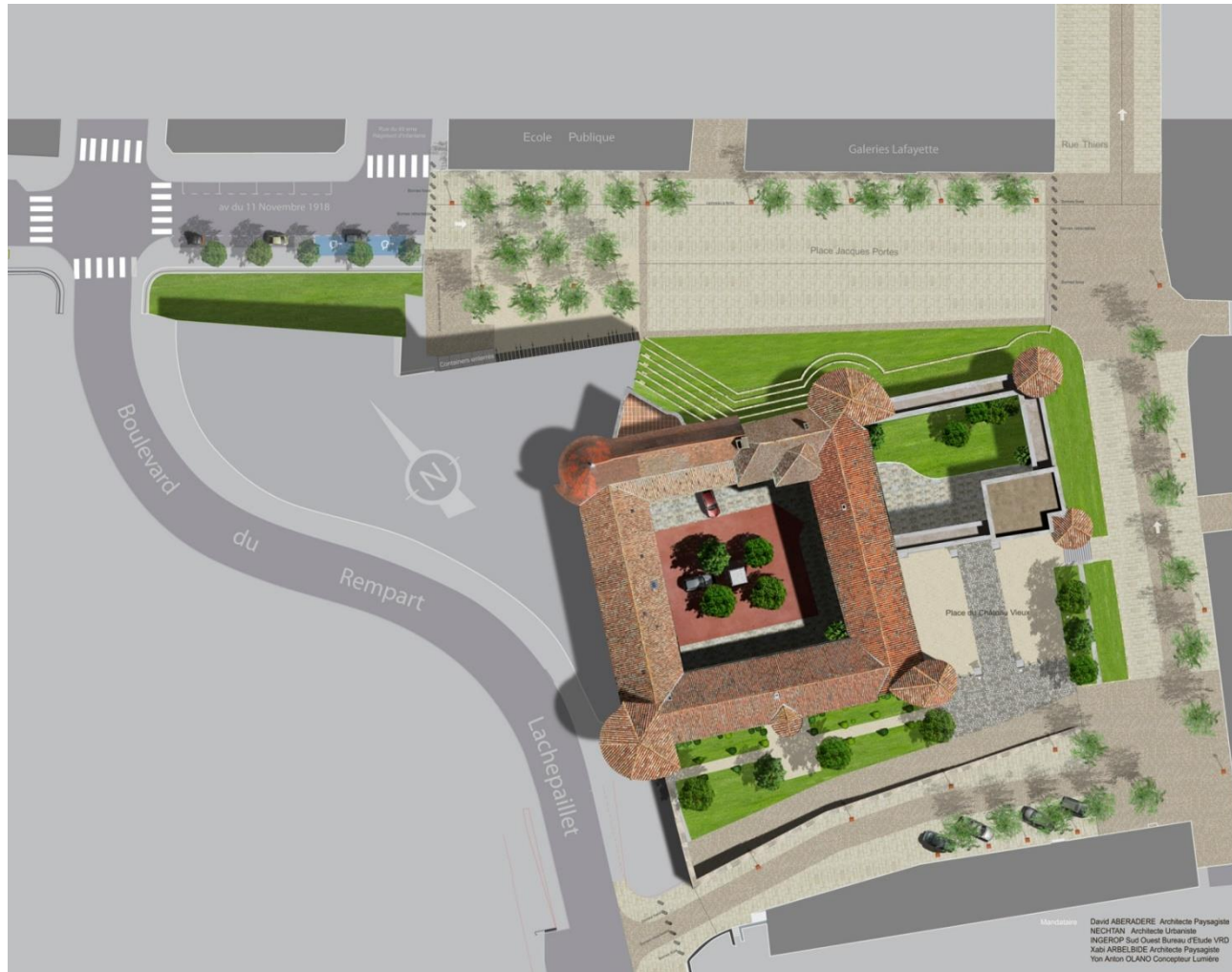
Vue en plan