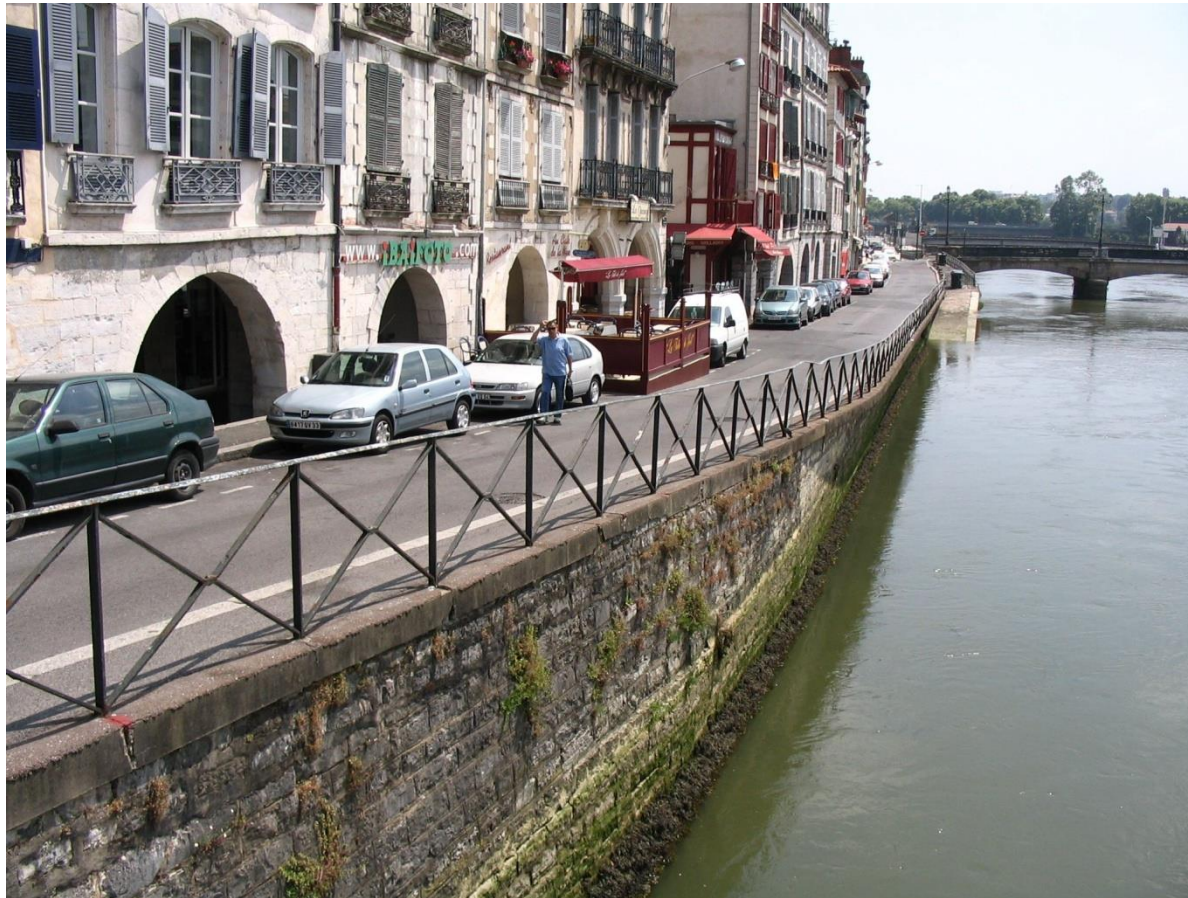
Vue du quai depuis le pont Marengo