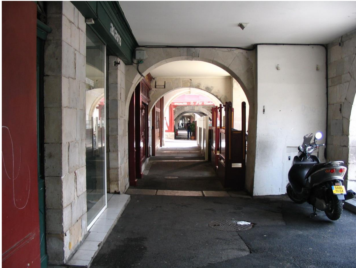
Vue sous les arceaux