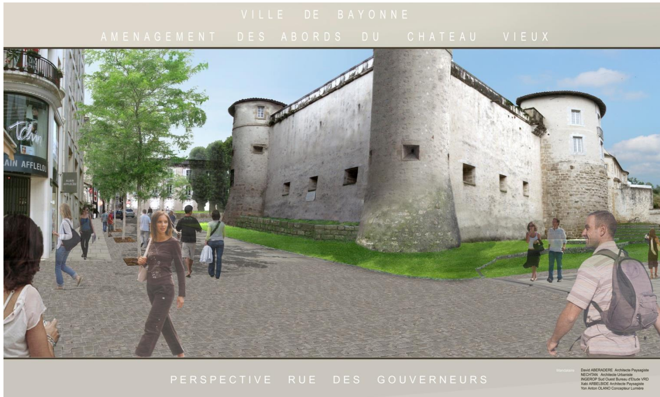
Vue depuis le début de la rue des Gouverneurs