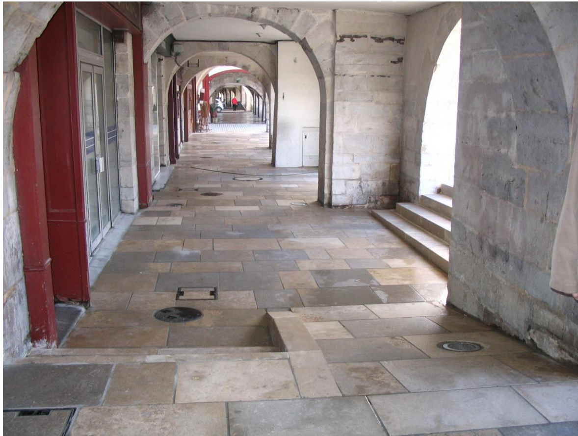
Vue sous les arceaux