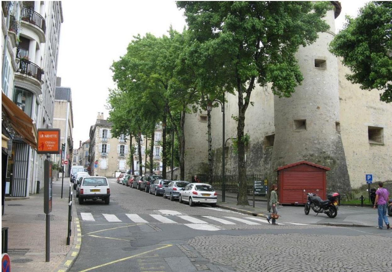
Vue depuis le début de la rue des Gouverneurs