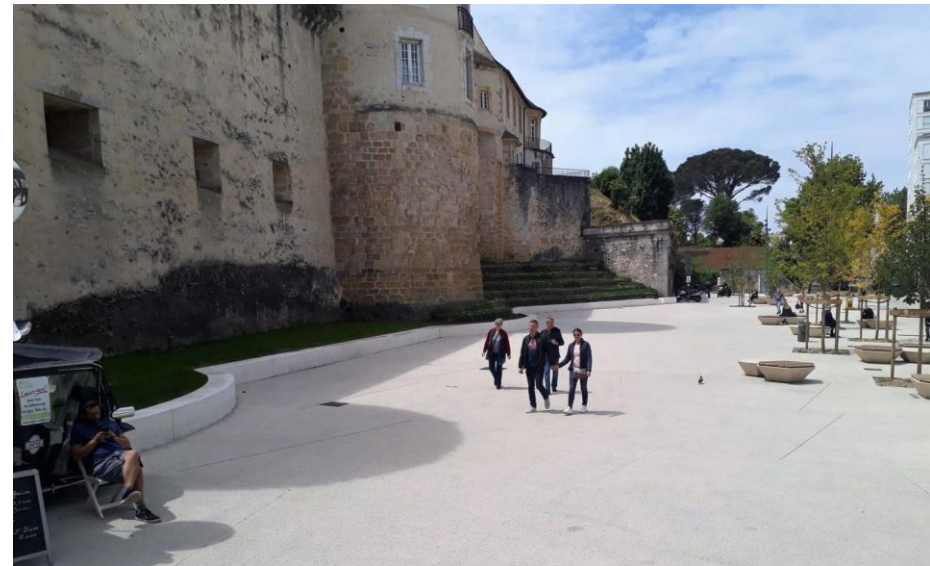
Vue de la place Jacques Portes