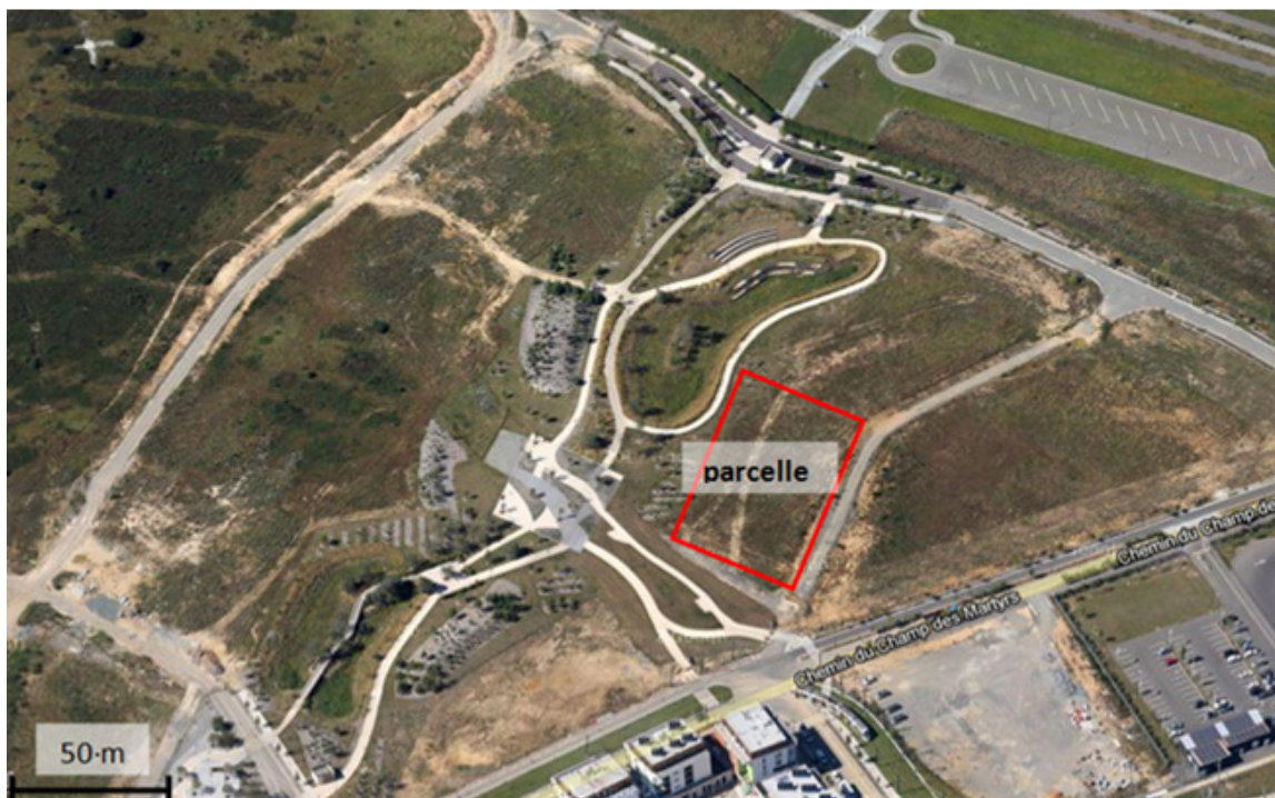
Vue aérienne de la parcelle à aménager