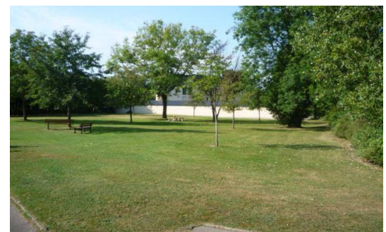
Vue sur la parcelle à aménager