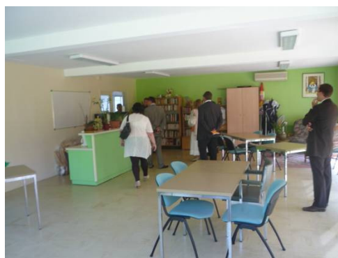
La salle commune de la RPA