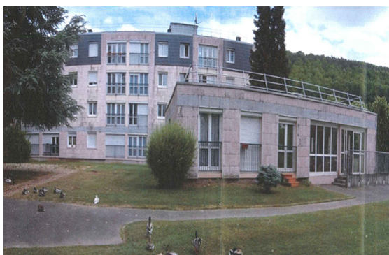
Résidence existante et son parc