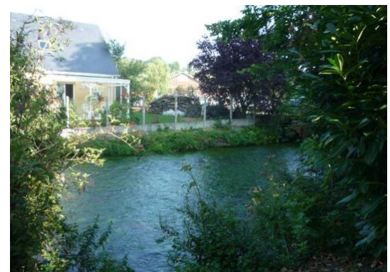
Vue sur le Cailly en bordure de la parcelle