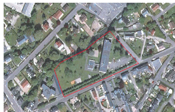
Vue du ciel de la parcelle (google maps)