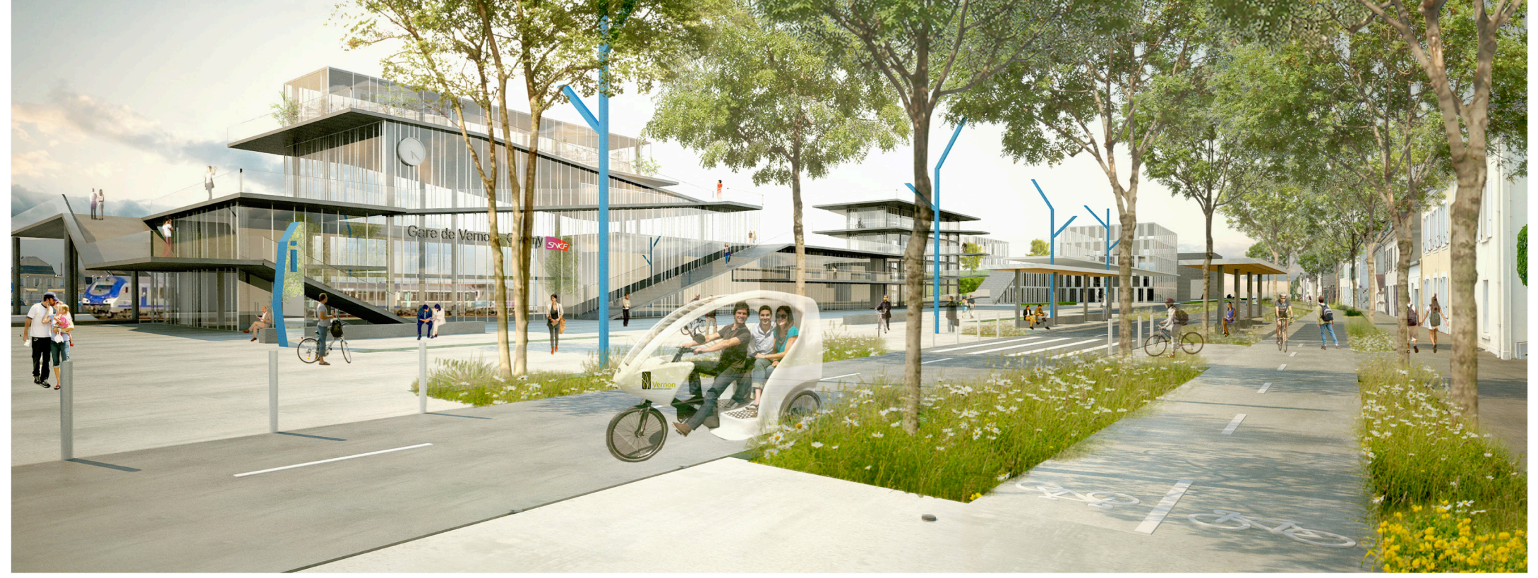
IN-SITU + NEW VERNON STATION

The activation of the four entrance doors in the city and its territory (the train station, cruises platform, the orchard, the Hebert islet), is then the opportunity carry a global reflexion on the strategic points and to lay the bases of a new system. It goes through the re qualification of these attractive poles, their revival and the processing of entrance's and transfer's sequences in the city through each of these doors.