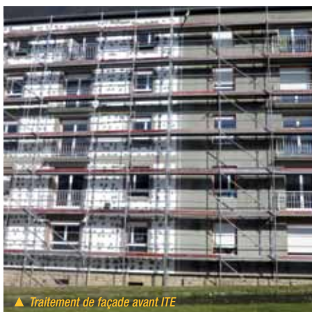
▲ Traitement de façade avant ITE