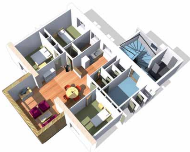
▲ Agrandissement en ossature bois

Redonner une nouvelle attractivité à un ensemble patrimonial devenu obsolète, c'est l'objectif poursuivi par Habitat 29 pour le quartier Woas Glaz à Landerneau. Située dans un quartier calme, mélange d'habitats individuel et collectif, à proximité immédiate du centre-ville, la résidence a été construite dans les années 50. Elle compte 134 logements répartis en 9 bâtiments collectifs de 5 à 6 niveaux, dispose d'une architecture simple avec toiture ardoise. Son fonctionnement est centralisé autour d'un cœur d'îlot principalement dédié à des zones de parking automobile, au détriment du piéton et de l'aménagement paysager. Les logements, quant à eux, ne répondent plus aux besoins actuels : trop petits pour y loger des familles, peu fonctionnels et peu performants sur le plan énergétique.