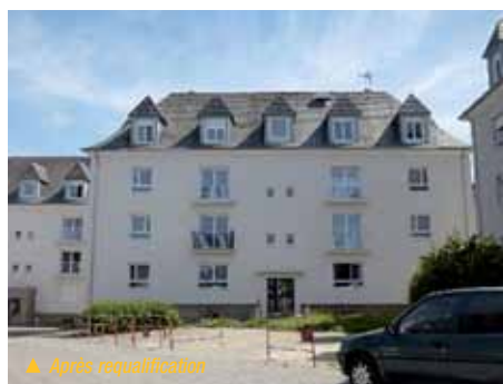
▲ Après requalification