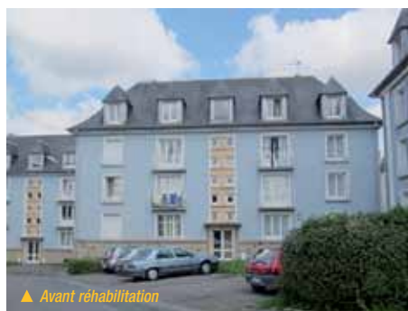
▲ Avant réhabilitation

ment le plus important fera, quant à lui, l'objet d'une intervention beaucoup plus lourde, qui prévoit des extensions en façade – colonnes préfabriquées en bois ou bois-béton mise en place à l'aplomb de l'existant pour agrandir les logements de près de 15 m 2 . Cette approche permet de revoir complètement la typologie des logements, avec accès PMR par des cages d'ascenseurs nouvellement créées. Dernier élément, la requalification urbaine du site pour l'ouvrir sur l'extérieur par une refonte complète du système viaire et un traitement paysager des extérieurs.