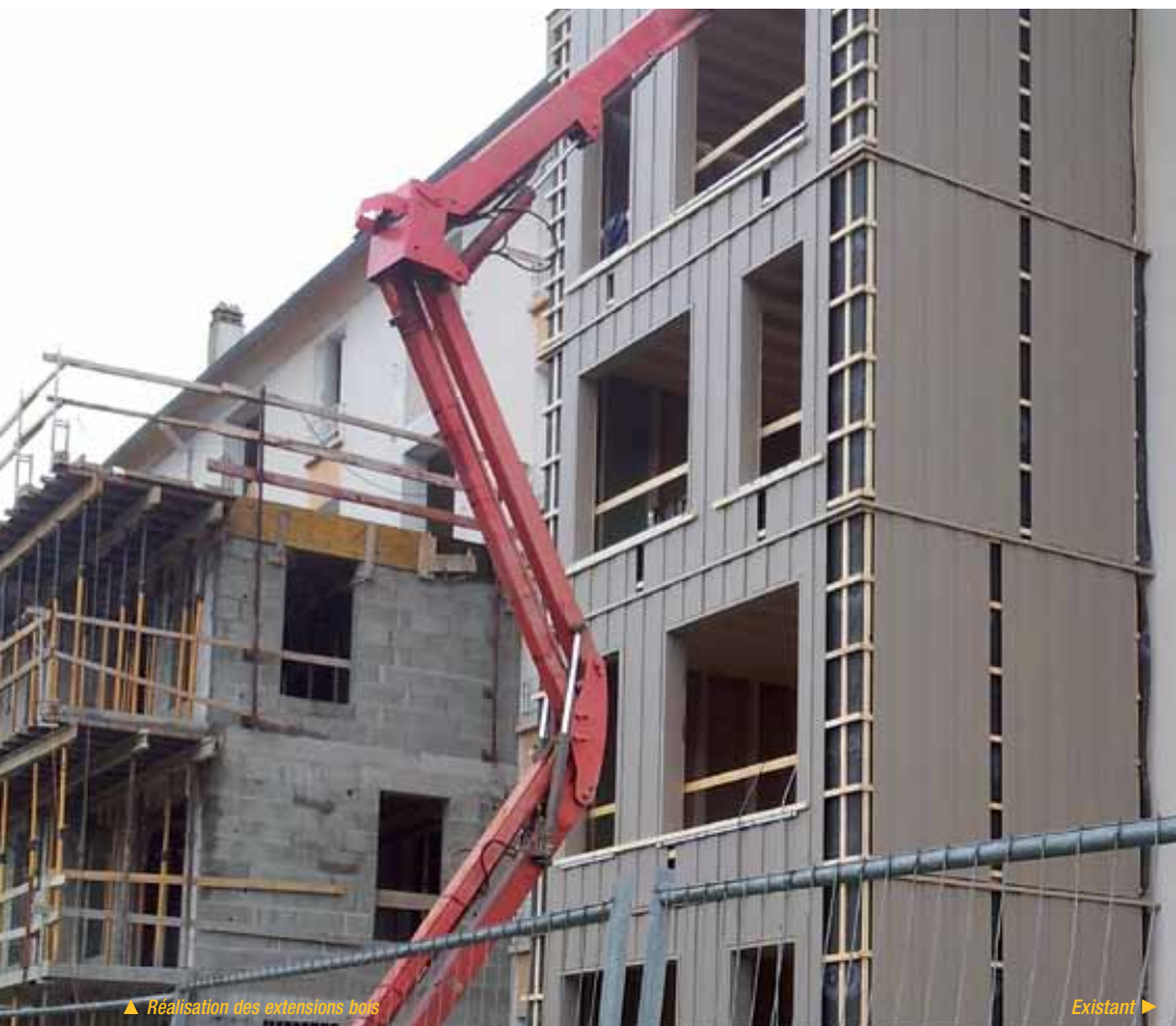
▲ Réalisation des extensions bois