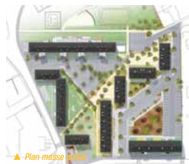
▲ Plan masse projet