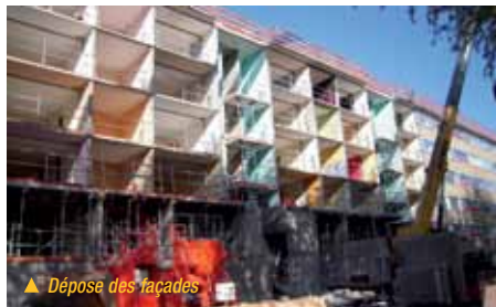
▲ Dépose des façades