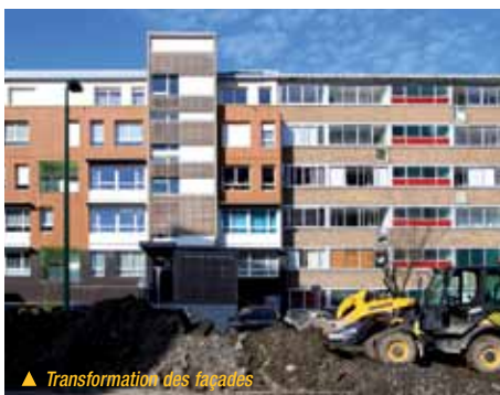
▲ Transformation des façades