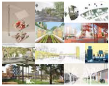
Les lauréats du concours European 13.