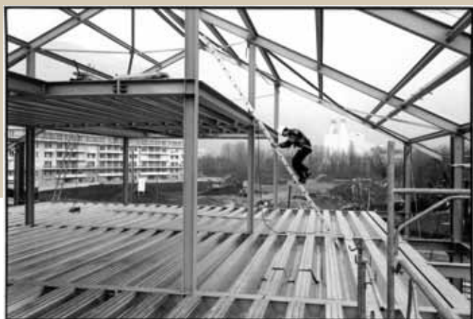
1996 – Saint-Martin-d’Hères – Chantier 2000.