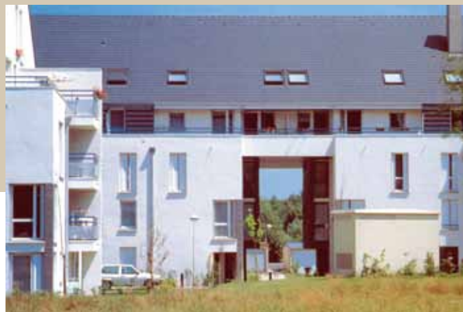
1999 – Verberie – REX HQE.

en différenciant les approches et les thématiques, qui interrogent d'un point de vue architectural et spatial le rapport entre intérieur et extérieur du logement. Espaces privés, semi privés et publics sont étudiés et mis en valeur à propos de tous les aménagements (jardinnet, cage d'escalier, rue, quartier, etc.).