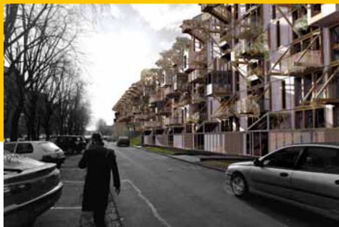
2011 – Réha – Projet des Ateliers Gens Nouveaux – Bâtiment Euclide à Tourcoing.