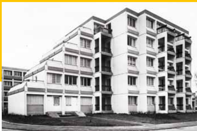
1972-74 – Nogent-sur-Oise – Procédé Variel – Architecte : G. Noël – 202 logements Hlm en 3 tranches – Modules tridimensionnels industrialisés béton.

D'après le bilan « 400 REX 1971-1981 » (hors programme PAN), les expérimentations « technologiques » dominent largement, suivies par les expérimentations « énergie » suscitées par les chocs pétroliers des années 1973 et 1978. La diversité architecturale, celle des procédés constructifs, témoignent du foisonnement des propositions soumises à expérimentation : procédés industrialisés multiples – béton, métal, bidimensionnels ou tridimensionnels, architecture (la bien-nommée !) « proliférante » et « meccano » où l'architecte s'exerce à une combinatoire assez ludique : « Marelles », « Tabouret », « Solfège »... Les dénominations expriment en elles-mêmes ce plaisir à créer, innover, rechercher. Cube et rectangle cèdent la place à la pyramide et à l'octogone. C'est Georges Maurios invitant l'habitant à se projeter dans son logement à l'échelle 1 et utilisant la vidéo, ce sont les logements surprenants de GRAC organisés autour de la cuisine, ce sont les « pyramides » où les logements s'enchevêtrent savamment. Si nombre d'opérations ont été évaluées, surtout à partir de la décennie 1990, les bilans restent souvent lacunaires,