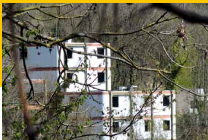
1973 – Nancy, rue de la Colline – Procédé Gamma – Architecte : Pariset – Projet mentionné au PAN – Procédé constructif : structure métallique.