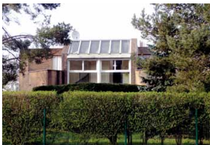
REX de Blagnac « capteurs solaires ».