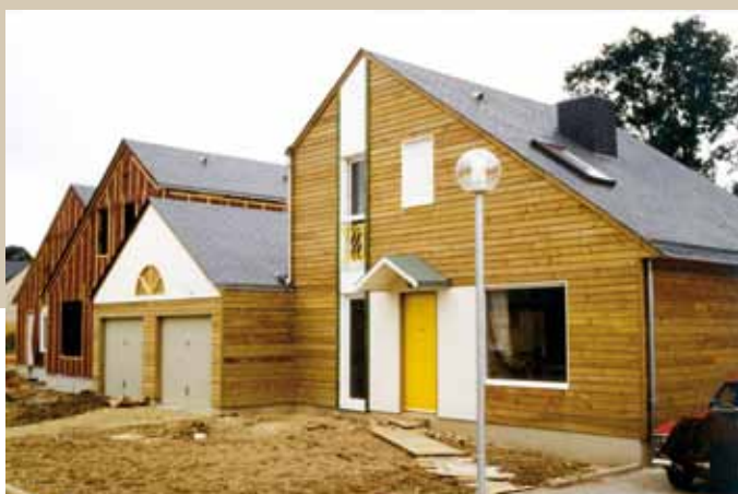
1986 – Le Rheu – 16 maison à 2 750 F / m 2 .