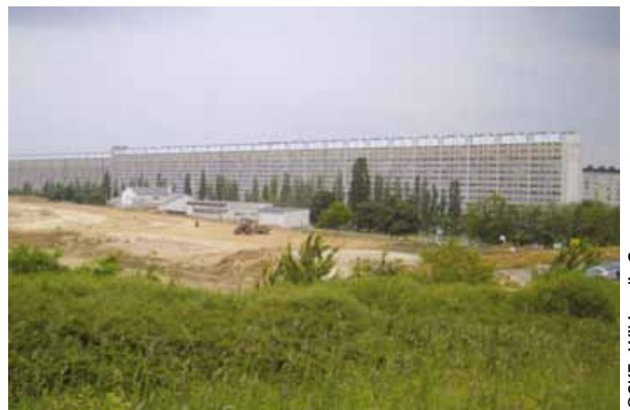
Nancy – la cité du Haut-du-Lièvre.

À la fin des années soixante, ce n'est plus tant la quantité qui importe que la qualité et les coûts. Les besoins se font moins pressants, la production en masse de logements n'a plus le même caractère d'urgence, même si la nécessité de résorption des dernières « cités de transit » et des « bidonvilles » s'impose encore. On remet en cause les « barres » et les « tours », pour des raisons de qualité du bâti et de qualité urbaine, mais aussi pour des raisons de qualité de vie et de sociabilité dans la ville. Les conditions de construction se modifient. C'est l'époque de la création des « modèles » - un architecte, une entreprise pour mener plusieurs opérations (le Plan construction, en collaboration avec la direction de la construction, leur offrira un prolongement sous l'appellation de « modèles-innovation »). Cette politique trouvera rapidement ses limites : opérations répétitives, conditions économiques parfois troubles. Les pouvoirs publics réalisent que les carences en matière de recherche et d'innovation dans le secteur de la construction sont importantes, même si des pionniers innovent avec audace. Les « modèles » reprennent corps, différemment, dans les « modèles-innovation » : « L'État intervient à ce stade pour soutenir la diffusion sur le marché