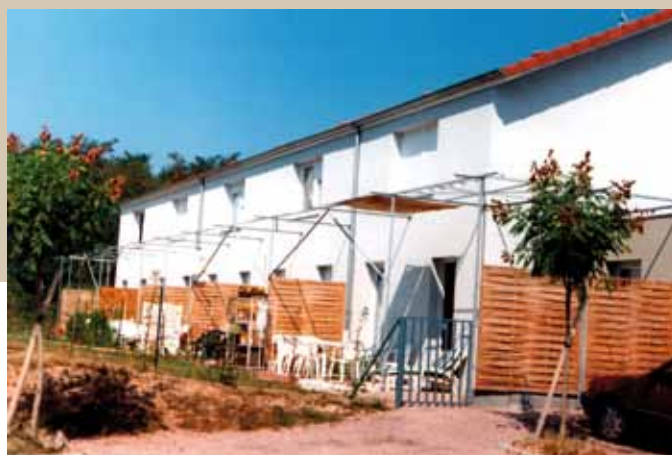
2000 – VUD – Montceau-les-Mines - La Sablière – 10 logements individuels.