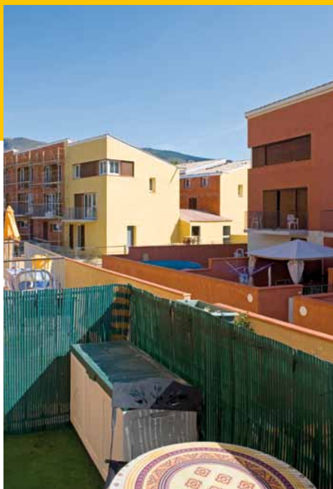
Dignes-les-Bains – VUD – La villa jardin cache son garage.

Sans doute, sur ce thème, les points de vue opérationnels développés au Plan Construction ont-ils évolué, oscillant du techniciste à l'organisationnel, tentant souvent de les concilier. « À l'époque, on a cru résoudre les problèmes d'adaptation au marché, au moins en partie, par « la précision dimensionnelle » appliquée dans le cadre d'une convention de coordination autorisant la création de systèmes « ouverts » par opposition aux systèmes dits « fermés » qui avaient montré leurs limites : de fait le besoin d'« adaptateur » aux interfaces subsiste, mais il ne s'agit pas seulement de son aspect matériel, il faut en effet que l'assemblage assure la