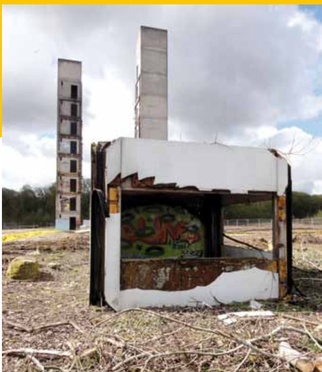
Ludres : les vestiges, en 2012, de la tentative de la SIHR.

des projets qui, sans son concours, ne passeraient pas le stade du prototype ou de la série expérimentale, soit que la nouveauté provoque l'hésitation des maîtres d'ouvrage, soit que les investissements préalables nécessaires ne puissent être envisagés si une commande d'amorçage n'est pas organisée... » (Robert Lion, directeur de la construction). Cette commande d'amorçage passera par une nouvelle instance, le Plan Construction. « Programme interministériel de stimulation de la recherche et de l'expérimentation dans la construction et précisément dans l'habitat », il sera l'outil voulu par l'État, dont les grandes lignes seront définies par les recommandations de la commission « recherche » du VI e Plan (1971-1975 - Paul Delouvrier, premier président du Plan construction, faisait partie de l'équipe de Jean Monnet lors de la création du Commissariat au plan en 1946). L'État saura laisser place à la « société civile » du secteur pour satisfaire au mieux à ces recommandations où apparaissent déjà l'impératif industriel, la compétition internationale, la division mondiale du travail, la nécessité de restructurer l'industrie et d'améliorer les relations sociales dans l'entreprise, le vœu de promouvoir la mobilité professionnelle. Les « modèles-innovation » seront parmi les premières réalisations expérimentales du Plan Construction.