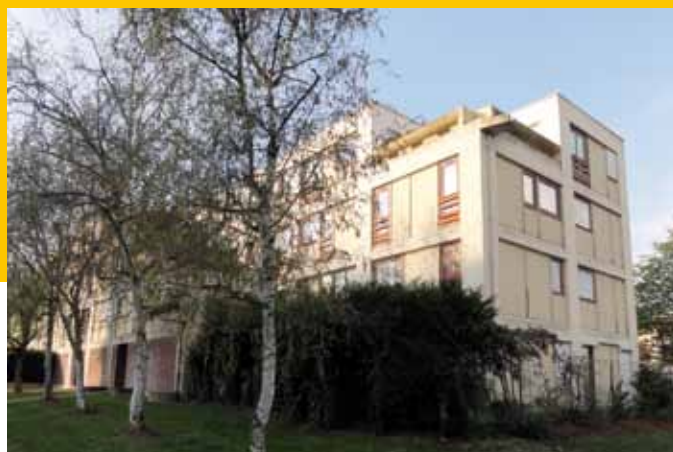
1973 - Val d'Yerres – Boussy-Saint-Antoine - Les Marelles – PAN - Architecte : Georges Maurios - 116 logements en accession - Flexibilité du logement + procédé de type « Meccano » – Appartements « à la demande », Structuration des logements par les futurs habitants (maquette + vidéo !) – « Réalisation expérimentale du Plan-Construction (REX) : poteaux-gaines sur trame carrée, prédalle pour les planchers, panneaux de façades. En 1974, ce même type de bâtiment sera agréé comme modèle-innovation. » (Georges Maurios) – en 2012.

sociales émergentes, art de l'architecte et savoir-faire empiriques. La sollicitation immédiate des sciences économiques et sociales est fortement affirmée : « Il faut rechercher si des coûts sociaux ne grèvent pas la société de charges induites (urbanisme mal compris entraînant des surcoûts de transport, accumulation de logements de même type accueillant des familles de même profil entraînant des frais supplémentaires pour l'enseignement, etc. » (Paul Delouvrier, avant-propos de Plan Construction, trois ans d'activité , mai 1971-décembre 1974). La préoccupation esthétique n'est pas absente : il s'agit aussi, selon la formule de Robert Lion, d'un « combat contre la résignation à la laideur ».