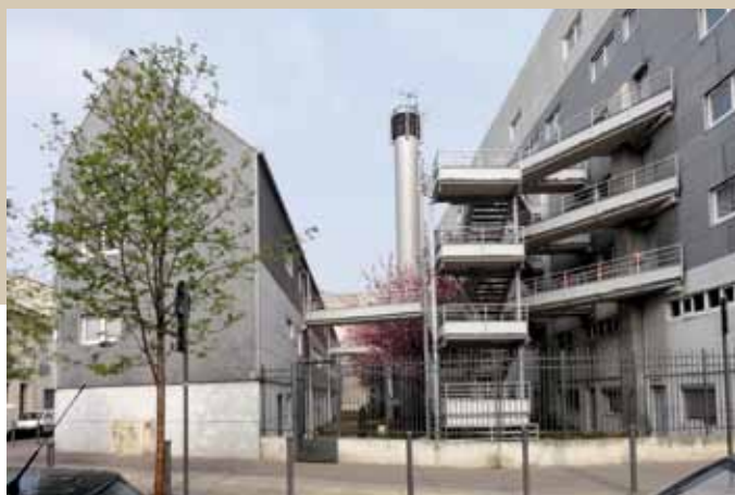
1987 – Saint-Ouen – rue Hermet – Architecte : Jean Nouvel – en 2012.