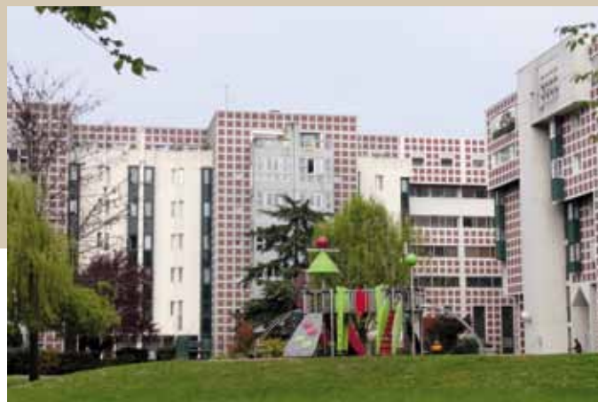
1976 – Marne-la-Vallée – La Noiseraie – Architecte : Ciriani - « porte urbaine » – 300 logements Hlm – en 2012.

de l'innovation : éléments coffrants isolants, isolation pariétodynamique, vitrages peu émissifs, menuiseries de fenêtres en PVC ou aluminium à coupure thermique, ventilation hygroréglable, générateurs à condensation... Le rapport d'évaluation du programme souligne la difficulté, en raison même de cette profusion, à évaluer l'impact industriel des expérimentations. Reste que H2E85 aura permis de renforcer la réglementation thermique, en la fondant non seulement sur les économies d'énergie, mais aussi sur la maîtrise des consommations. Le programme aura une suite : H3E90, programme consacré à l'habitat existant.