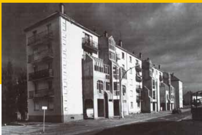
1973 – Dreux – Cité du Lièvre d’Or – Réhabilitation bioclimatique.