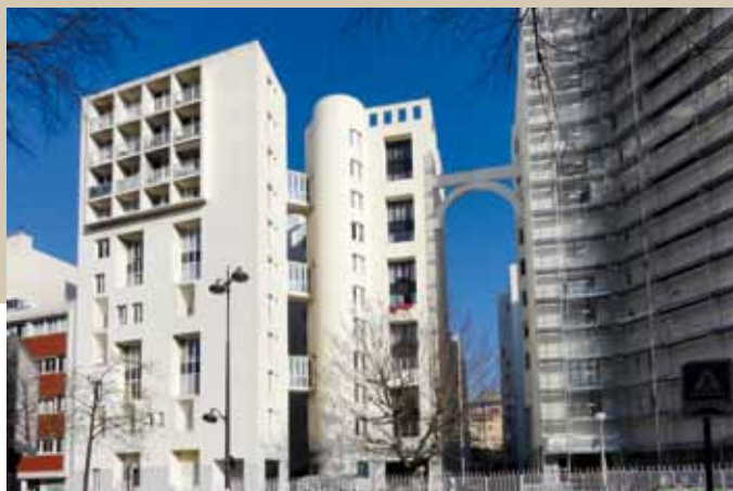
1975 – Paris – « Les Hautes Formes » – Architecte : Christian de Portzamparc – en 2012.