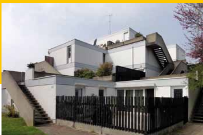
1972 – Villepinte, Cité des Pyramides – Architectes : Michel Andrault et Pierre Parat – ici, en 2012.