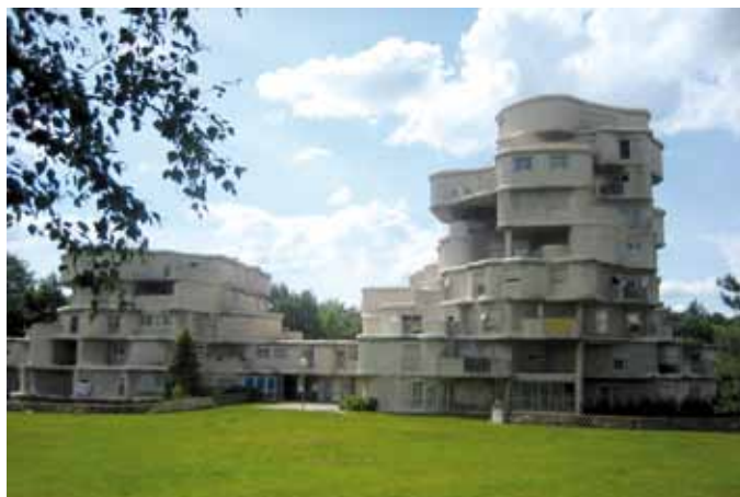
1971 – « Les Rochers » à Angers – Architecte : Vladimir Kalouguine.

malgré une volonté répétée de diffuser l'innovation. D'où l'intérêt de simplement retourner sur les lieux : les gradins-jardins sont plébiscités par leurs habitants, les jardiniers urbains sont satisfaits de leurs « maisons individuelles superposées ». Les Rochers de Vladimir Kalouguine continuent de séduire les Angevins, quand bien même le projet de végétalisation initial n'a jamais pu aboutir... Les Marelles de Georges Maurios, inscrites dans le mouvement de l'industrialisation ouverte, se sont résidentialisées, enfermées dans une clôture grillagée. Étrange retournement de l'histoire : les Gamma de Nancy, qui après sinistres et surcoûts avaient à l'époque dissuadé le maître d'ouvrage de poursuivre toute expérimentation et entraîné de lourdes procédures judiciaires, devraient, en 2012, reprendre du service après être devenues friches à risques, sous le nom de pavillons Gamma et au titre de la mémoire de la construction.