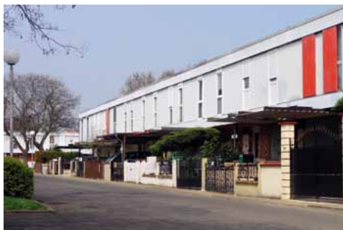
1972 – Villepinte - Les Mousseaux – Architectes : Marcel Lods, Paul Depondt, Henri Beauclair – en 2012.

De 1971 à 1978, cinq programmes sont mis en place : Coût global de l'habitat, Conception et architecture pour un habitat de qualité, Nouvelles techniques et construction par composants, Amélioration de l'habitat existant, Économies d'énergie et utilisation des énergies nouvelles dans l'habitat . Ces programmes s'appuient sur des groupes de travail : industrialisation ouverte, technologies, mobilité – flexibilité – obsolescence du logement, sciences humaines, information et pédagogie de l'habitat, l'habitat ancien et son amélioration... Les groupes de travail spécialisés se multiplieront au fil des années – vingt en 1977 ! – en fonction de missions et de problématiques techniques nouvelles. En relation avec le ministère de l'Équipement et du Logement est lancé en 1972 le programme « PAN » (Programme architecture nouvelle).