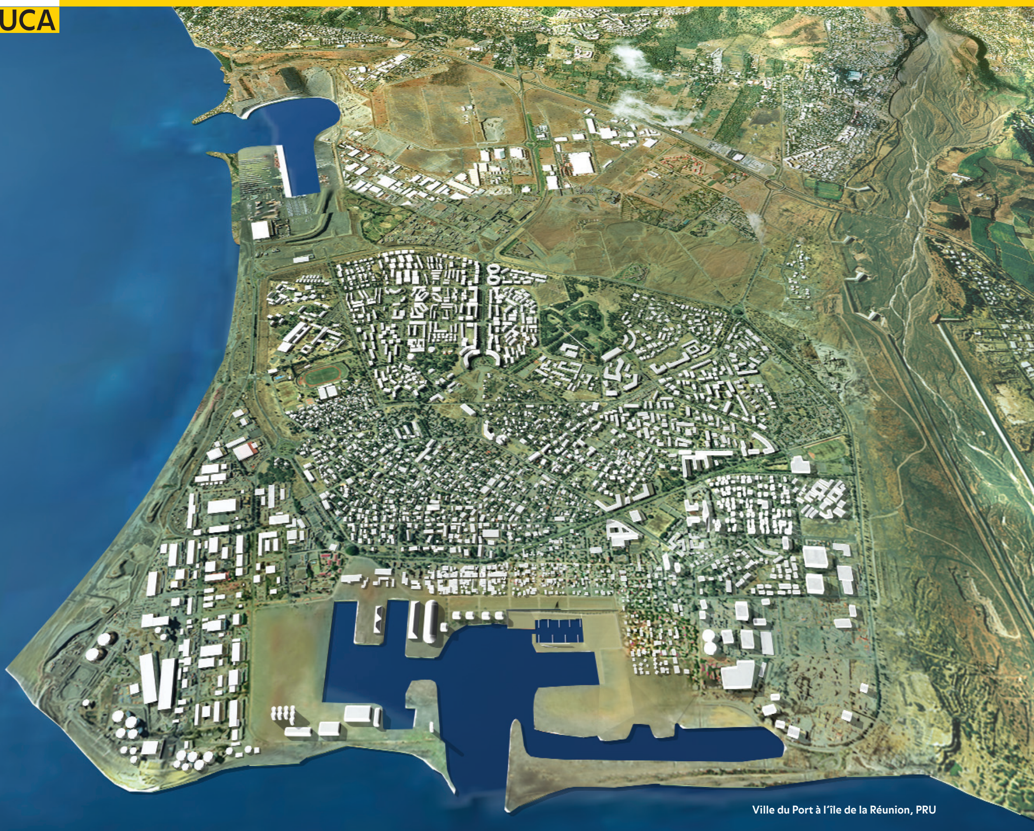
Ville du Port à l'île de la Réunion, PRU