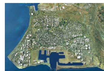
Ville du Port à l'île de la Réunion, PRU