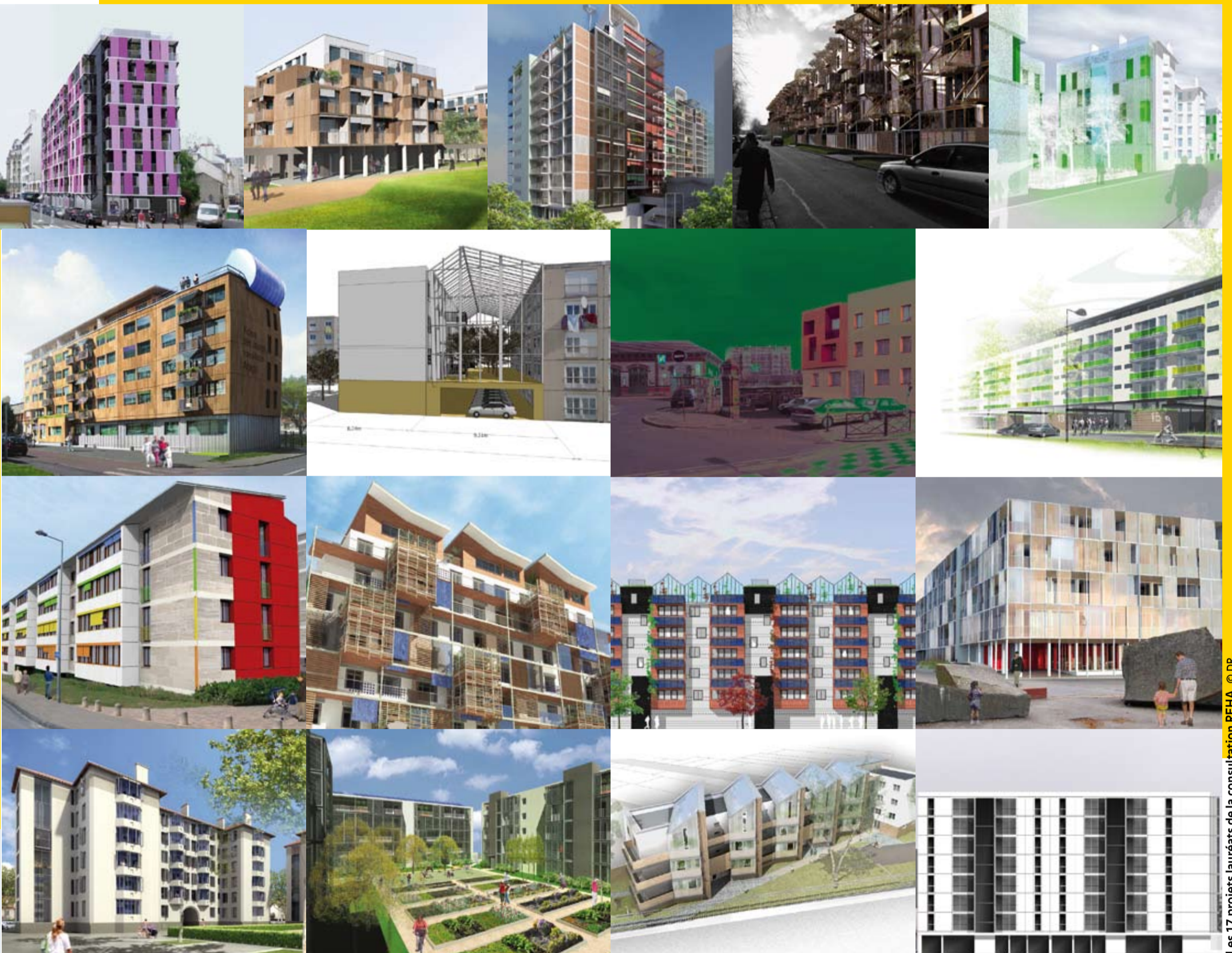
Les 17 projets lauréats de la consultation REHA.

DOSSIERS Programme logement design pour tous – Programme requalification de l'habitat collectif à haute performance énergétique (REHA)