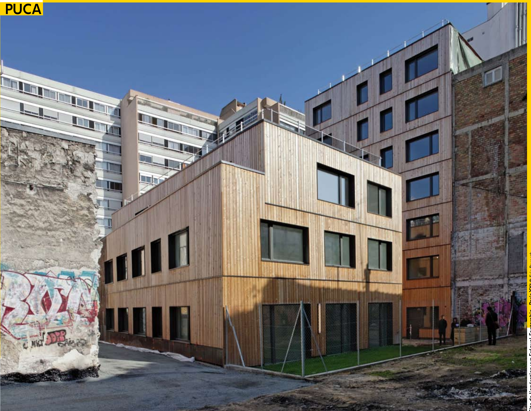
Site de l'opération vud Fréquel-Fontarabie - Paris XX e