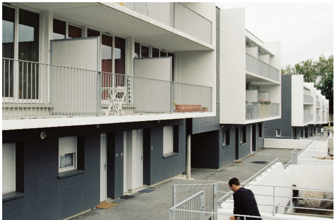
Opération VUD à Rouen - Caserne Péliissier