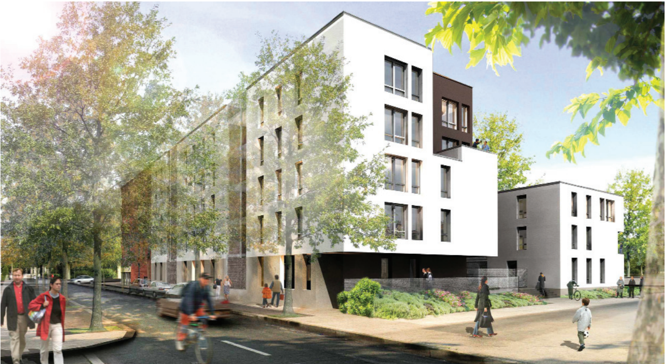
Foyer du Toit Familial, 42 logements, quartier Grammont, Olivier Méheux (TOA)