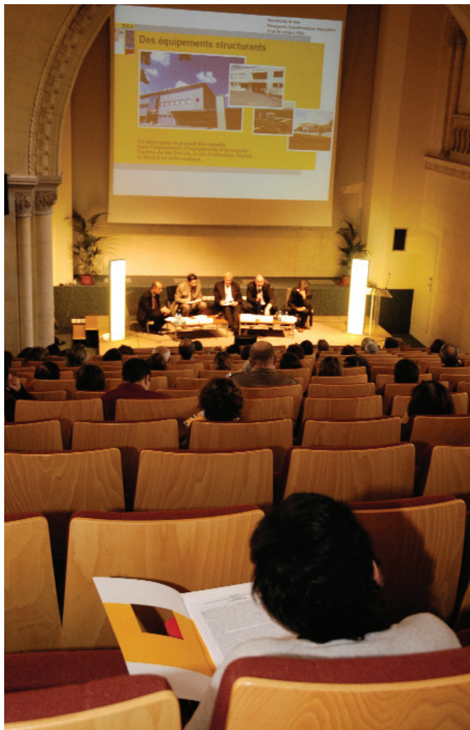
Espace du Moineau Rouen

Contraints à l'innovation et au renouvellement, techniciens et élus sont en quête de supports théoriques voire de cautions conceptuelles - développement durable, gouvernance urbaine, participation des habitants, qualité architecturale - qui sont indispensables à la mobilisation des énergies. L'intrication du scientifique et du politique est une des réalités de la manière dont se fait la ville. A l'inverse, les chercheurs sont confrontés à la difficulté d'une analyse cherchant à distinguer ce qui émerge - peut-être -, ce qui se transforme - sans doute - et ce qui se poursuit - aussi. L'une des fonctions du PUCA est de permettre aux uns et aux autres de se poser autour d'une table ou d'un atelier, et de vérifier s'ils regardent et s'ils voient la même chose de la ville.