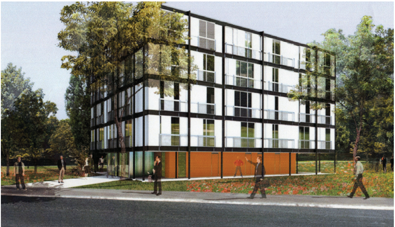
Réhabilitation Verre et Acier de Marcel Lods - Maîtrise d'œuvre Nicolas Michelin