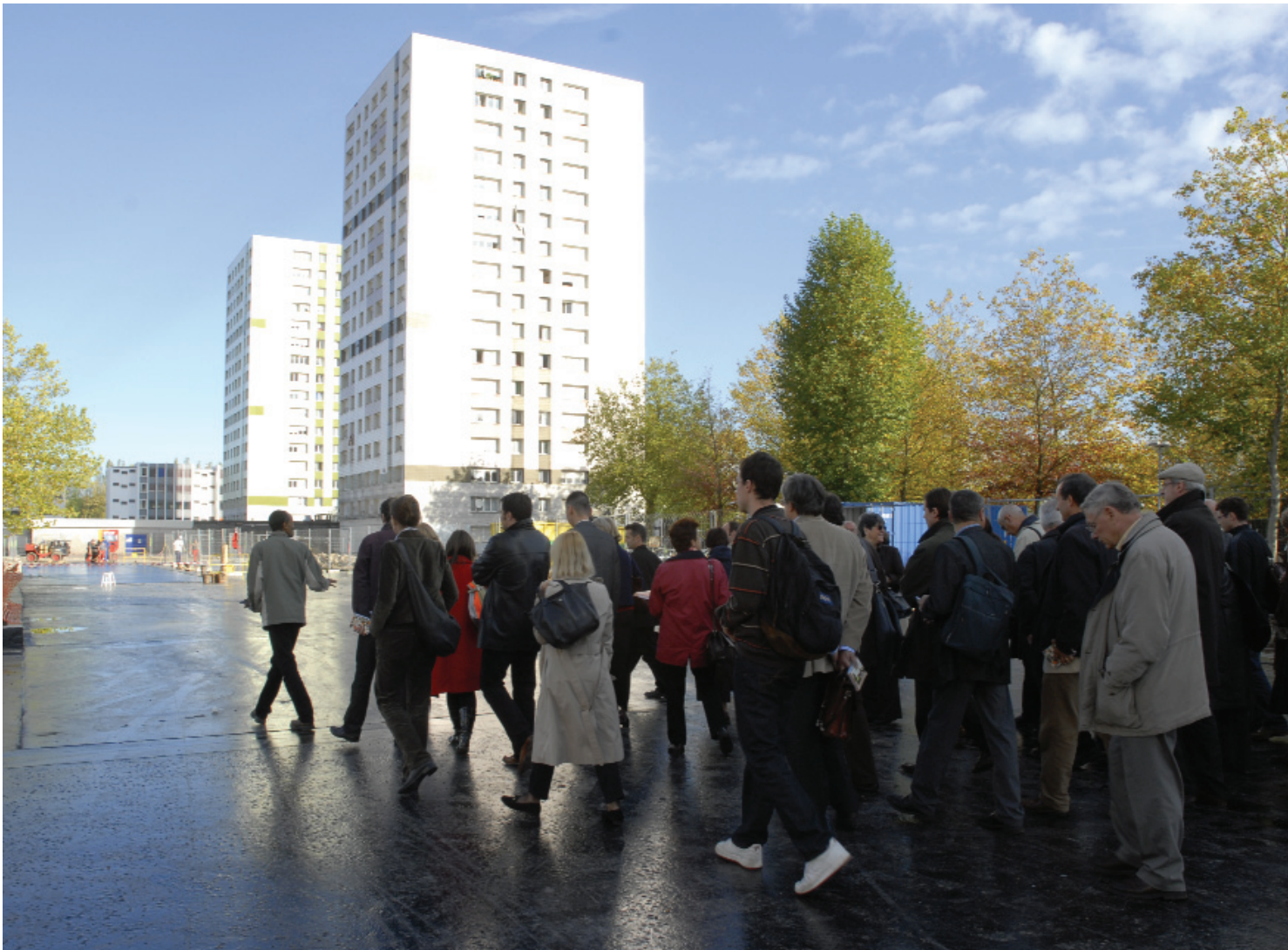
Esplanade Malraux - La visite du quartier de la Grand'Mare, Rouen

“Travailler à l'échelle du quartier, de la ville, mais aussi de l'aire urbaine”