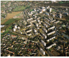
Quartier du Châtelet, Rouen