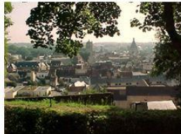
DREUX : 10 février