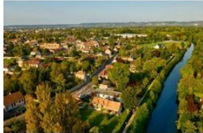
LOUVIERS: 8 février