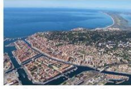
SETE: 29 janvier