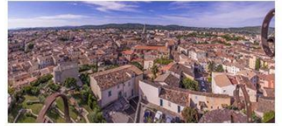
DRAGUIGNAN: 4 février