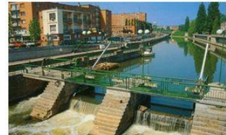
MAUBEUGE: 12 février