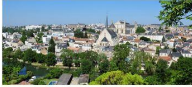
POITIERS: 2 février