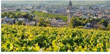
EPERNAY : 27 janvier

Pour les 7 « Territoires Pilotes de Sobriété Foncière » lauréats: lancement local par le Directeur national du programme Action Cœur de Ville et la Secrétaire Permanente du PUCA. Echanges avec les élus et les acteurs