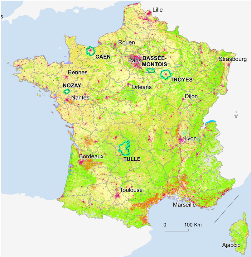
CARTE 2 : DES TERRITOIRES PÉRIURBAINS (CF OUVRAGE, LE PÉRIURBAIN, ESPACE À VIVRE, P. 13)