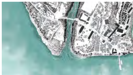
Stratégie de projet : "remonter" dans les mornes