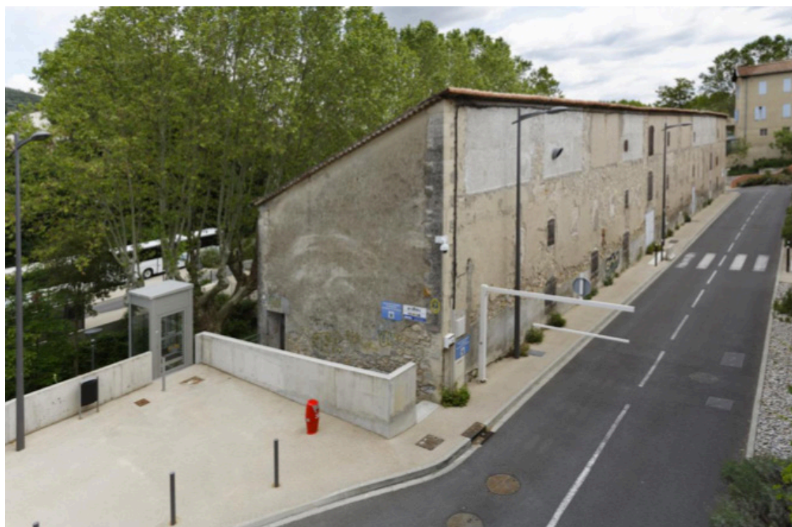
Photos du site actuel.