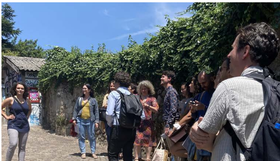
Parcours commenté dans le centre-ville de Foix, juin 2021

Ces séminaires sont organisés en collaboration avec les collectivités partenaires du programme et accueillis dans les territoires. Événements à la fois cognitifs et festifs, ces séminaires sont marqués par des temps de débats et de restitution publique, mais s'accompagnent aussi de visites des territoires, d'expositions, d'ateliers avec habitants, enfants, étudiants, etc., au fil des envies de faire qui émergent localement.