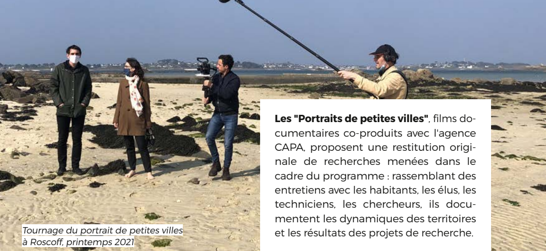
Tournage du portrait de petites villes à Roscoff, printemps 2021

Les "Portraits de petites villes", films documentaires co-produits avec l'agence CAPA, proposent une restitution originale de recherches menées dans le cadre du programme : rassemblant des entretiens avec les habitants, les élus, les techniciens, les chercheurs, ils documentent les dynamiques des territoires et les résultats des projets de recherche.