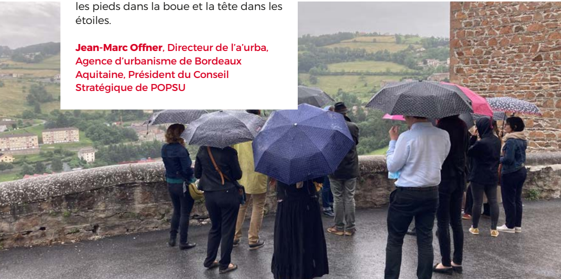
Parcours commenté, Thizy-Les-Bourgs, juillet 2021