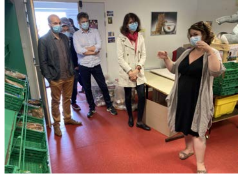
Visite de l'épicerie sociale et solidaire, Tournus, juin 2021