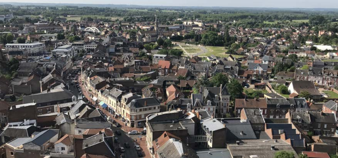
Vue aérienne de Chauny

monde de la recherche, et les enseignements et les questionnements des chercheurs vont explorer en profondeur les actions menées et de leurs impacts, en contribuant directement à la prise en compte plus large des enjeux et leviers, et à la construction collective du récit territorial. Enfin, ces échanges alimentent une vision plus prospective, indispensable au temps long des politiques publiques locales, nationales, et européennes et internationales.