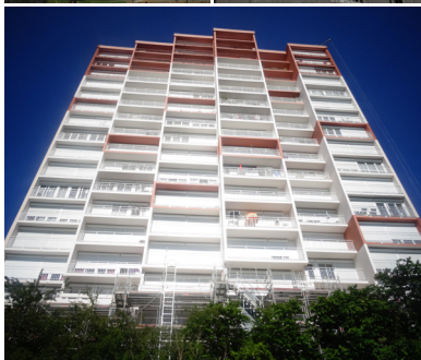
Rénovation énergétique sur la copropriété de Montataire réalisée par Picardie Pass Rénovation