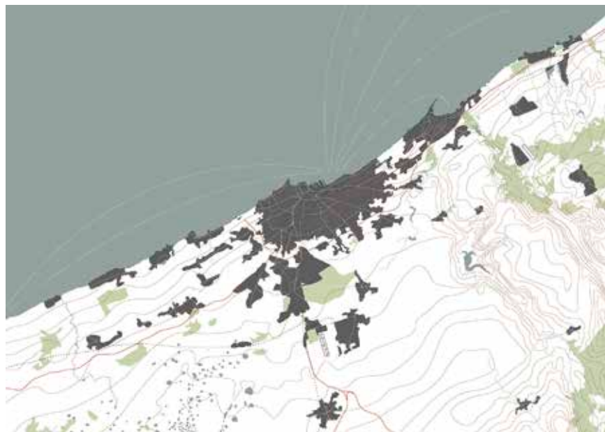
Casablanca, « La Fabrique du territoire », dir. L. Hodebert, étudiants : J. Bracco, B. Coëz, A. Fatichi, L. Gaynard, S. Gouirand, I. Maire, P. Taly.

Dans le cadre de l'exposition « Connectivités » présentée au MuCEM, les étudiants de l'École nationale supérieure d'architecture (ENSA) de Marseille ont cartographié quatre métropoles-mégalo-poles au sein du séminaire « La fabrique du territoire », sous la direction