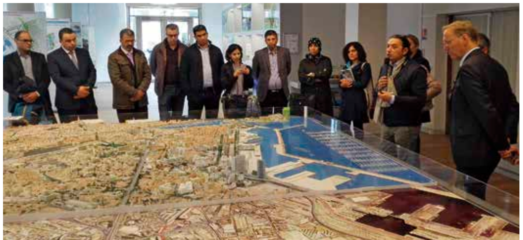
Présentation du projet Euroméditerranée à Marseille