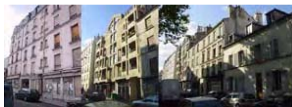
rue de Fontarabie

Les axes de développement durable devront intégrer les caractéristiques de l'îlot, la spécificité de chaque programme : logements neufs, logements réhabilités, équipements publics, espaces publics de voirie, de jardin et les particularités des différents maîtres d'ouvrage concernés par cette opération : OPAC de Paris, SIEMP, directions de la Ville de Paris.