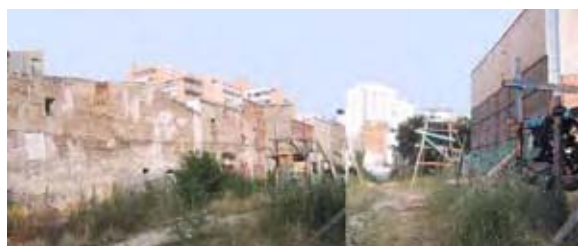
arrières des bâtiments du passage Fréquel

Un bureau d'études spécialisé en Haute Qualité