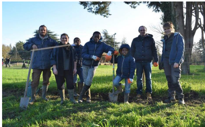
Journée de plantation participative de la haie paysagère 15/01/2020