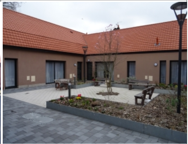
Villeneuve d'Ascq – la cour, un lieu de rencontre permettant une bienveillance mutuelle