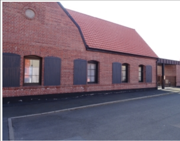
Villeneuve d'Ascq – une ancienne ferme rénovée