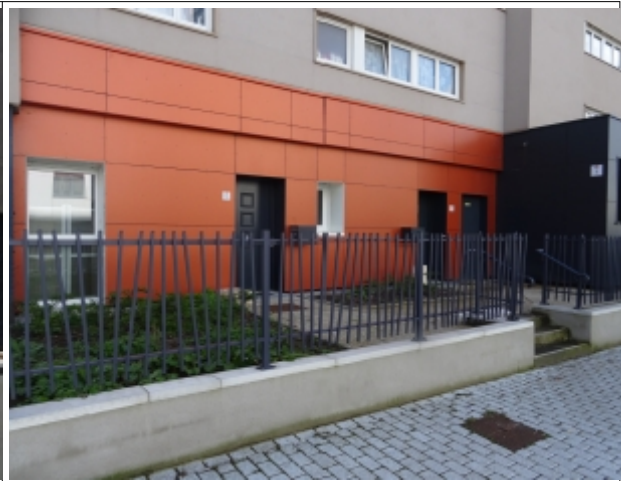
Lambersart – entrée individualisée des logements