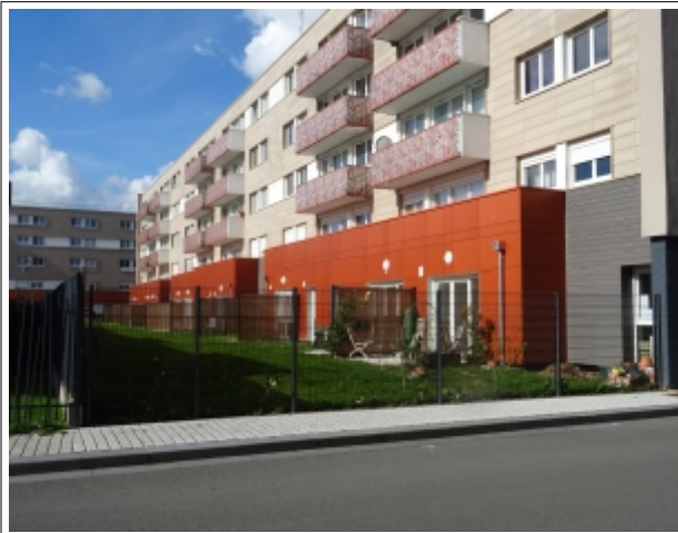
Lambersart – un jardin commun aux 8 logements