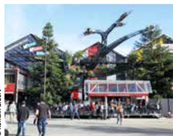
L'Île de Nantes.