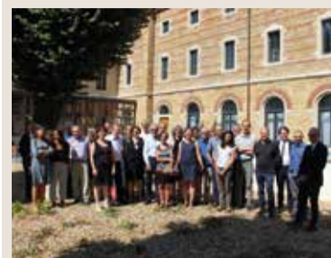
Séminaire Bilan et perspectives POPSU 2, 1 er septembre 2016

Dans le cadre de la valorisation des résultats du programme POPSU 2 lancé en 2011 sur dix grandes agglomérations, et dans le prolongement de la collection d'ouvrages publiée aux éditions du Moniteur, le PUCA organise dans huit métropoles françaises, des rencontres rassemblant chercheurs, élus et praticiens. Leur ambition est de débattre des dynamiques urbaines à l'œuvre dans chacune d'elles et d'en diffuser les enseignements les plus marquants. Constituées à partir des 5 thématiques du programme – l'économie de la connaissance, la régulation urbaine, les fragilités urbaines, le développement durable, les gares et pôles d'échanges – ces rencontres, conçues sous la forme d'un dialogue interdisciplinaire, poseront les bases d'un futur programme de recherche. Elles seront clôturées par un colloque international à Paris les 14 et 15 septembre 2017.