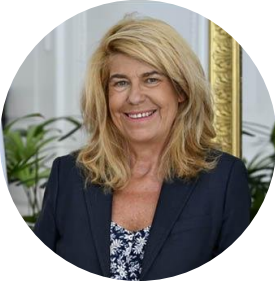
Dominique Faure , Ministre déléguée chargée des Collectivités territoriales et de la Ruralité