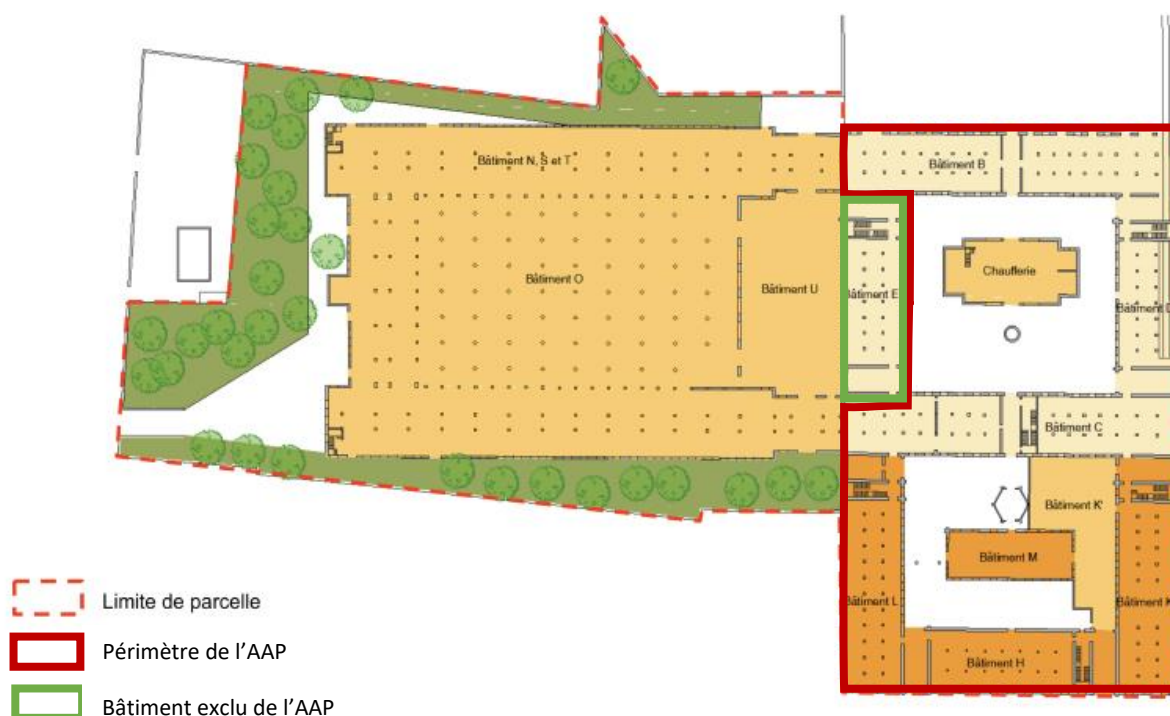
Figure 6 : Plan de repérage des bâtiments

Le bâtiment E, exclu de l'appel à projets, constitue le périmètre d'un futur équipement public de la commune de Tonneins. Aussi, il sera à prendre en compte comme un élément de contexte du projet proposé par les groupements candidats. En effet, la municipalité souhaite y installer un vaste pôle culturel regroupant le service culturel de la commune, la médiathèque (jeunesse et adultes), une salle de spectacles (d'une capacité d'environ 100 personnes) et une salle d'exposition. Le lieu pourrait également accueillir une Micro-Folie et un lieu dédié à la mémoire du tabac.