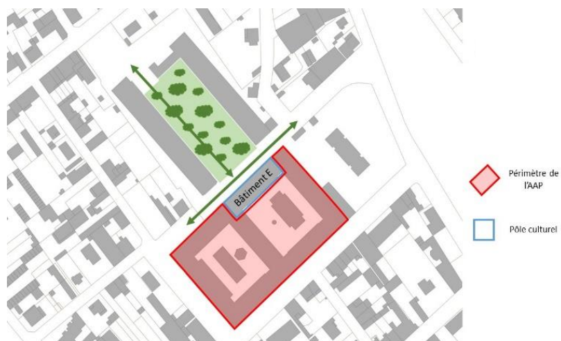
Figure 4: Emprise foncière proposée dans le cadre de l'appel à projets