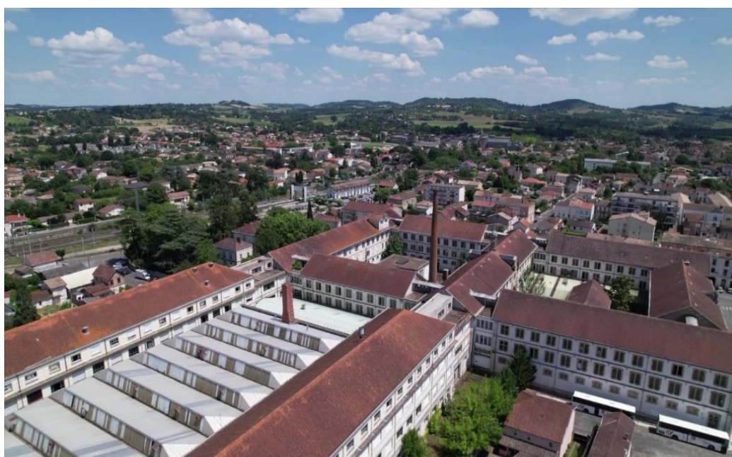
Figure 5: Manufacture des Tabacs de Tonneins