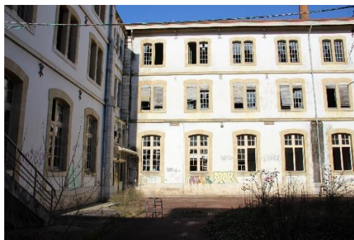
Figure 1 : Manufacture des Tabacs de Tonneins