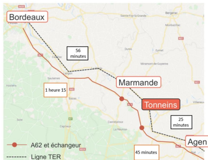
Figure 2 : Situation géographique de Tonneins

Située dans l'une des régions les plus attractives de France et sur l'axe Bordeaux – Toulouse , la commune de Tonneins s'inscrit dans un territoire qui bénéficie d'une position stratégique en Nouvelle-Aquitaine. Desservie par de grands axes de communication, à travers l'autoroute A62 (liaison Bordeaux – Toulouse), la RD 813 (axe Bordeaux – Marseille) et la ligne TER (Bordeaux – Agen), la commune de Tonneins permet ainsi un accès facilité à Marmande, mais également à la métropole bordelaise et à l'agglomération d'Agen .